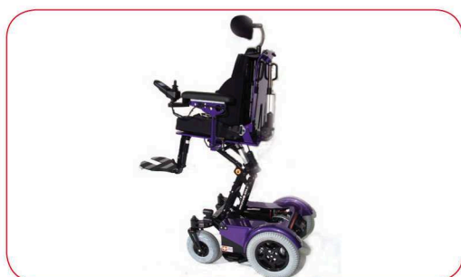
Höher hinaus mit 50 cm Hub Erleichterung der Arbeitsverrichtung und bessere Teilnahme an Aktivitäten, wie zum Beispiel in der Küche, beim Einkauf oder bei Gesprächen in Augenhöhe mit dem Gegenüber.