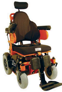
Elektro-Rollstuhl Phönix P7h - mit Hinterradantrieb