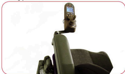
Auf beide Seiten abschwengbare Steuerung begünstigt das einfachere Anfahren eines Tisches oder ähnlichem.