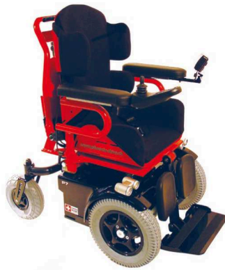
Elektro-Rollstuhl Phönix P7 - das Multitalent