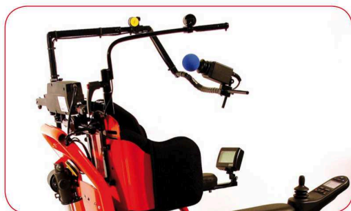
Neue Steuervorrichtungen wie Kinnsteuerung, Blas-Saugsteuerung, Kopfsteuerung, Fingersteuerung, Tischsteuerung usw. Die Steuervorrichtungen lassen sich einfach an das System anschließen und ermöglichen die Anwendung zahlreicher individuell angepasster Funktionen.